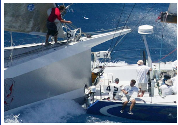
Der Stärkere hat immer Vortritt .....

Ein Vorschoter ist ein Mensch, der mit Dir segelt, obwohl er Dich kennt.