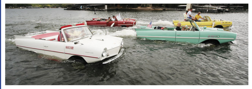
Eine Regatta mal anders .....