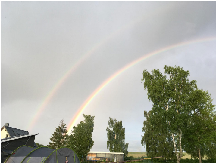
Bilder Manu und Urs Düscher